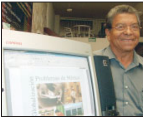
"PROBLEMAS ECONÓMICOS DE MÉXICO", ES PARTE DEL ACERVO VIRTUAL.