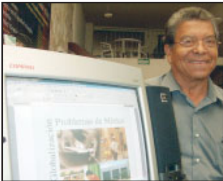
"PROBLEMAS ECONÓMICOS DE MÉXICO", ES PARTE DEL ACERVO VIRTUAL.