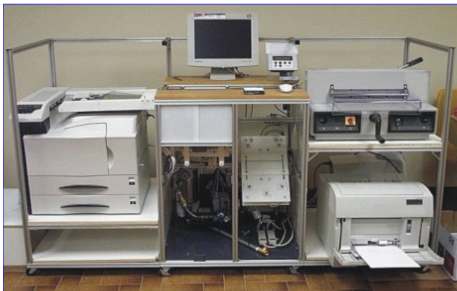
Instalace InstaBook Makeru

Zmíněné komponenty zajišťují kvalitní a výkonné zpracování, přinejmenším co se oficiálně udávaných parametrů týče: Epson 2200 je sedmibarevná tiskárna, pracující v maximálním rozlišení 2880 krát 1440 dpi, jejíž výtisky mají udávanou životnost víc jak 90 let. FS-9500 DN tiskne rychlostí 50 stránek za minutu (resp. 100 stran textu, neboť je podporován duplexní tisk) při standardním rozlišení 600 krát 600 dpi (maximum je 1800 krát 600 dpi), maximální měsíční zátěž je stanovena na 300000 stránek měsíčně. Patentovaná technologie zajišťuje podle tvrzení výrobce u dokončovacího systému podstatně větší výdrž lepené vazby než u obvyklých řešení. Systém zaujme i svými rozměry, když pro svou instalaci vyžaduje údajně pouhý jeden krychlový metr prostoru.